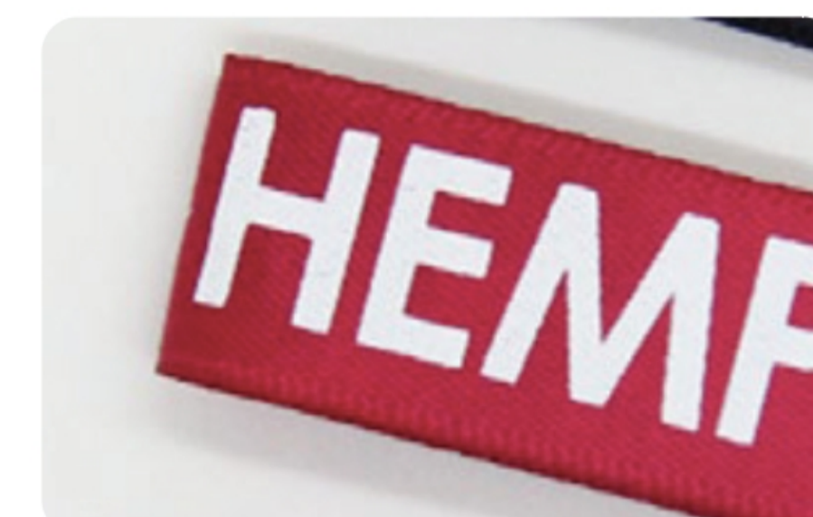
Thermal transfer printing